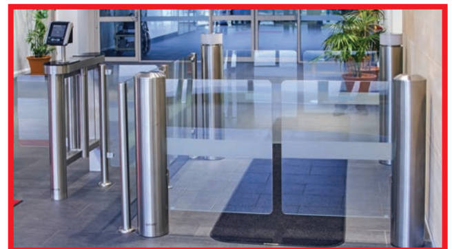
Instalación de dos unidades enfrentadas.